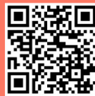
WIR AUF INSTAGRAM